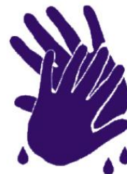
Skyll og tørk