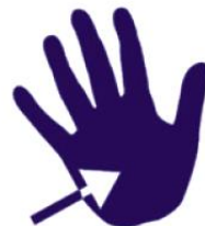
Bakside av hender