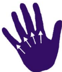
Nedsiden av fingre