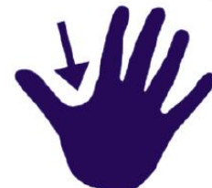
Nedsiden av tommelen