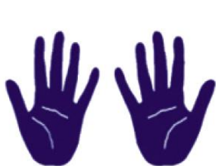
Håndflate til håndflate